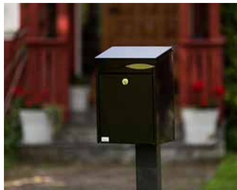
Villa Formfin med lås i front:

Låsen sitter godt beskyttet under topplokket. Innkast og uttak av brev skjer fra toppen av postkassen. Postkassen tar imot brevpost inntil brevlukens størrelse. Låsen må stenges før nøkkelen kan fjernes.