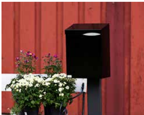
Villa Formfin med lås i topp:

Låsen sitter godt beskyttet under topplokket. Innkast og uttak av brev skjer fra toppen av postkassen. Postkassen tar imot brevpost inntil brevlukens størrelse. Låsen må stenges før nøkkelen kan fjernes.